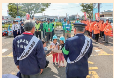
10/9 福島北地区 幼稚園児の地域安全宣言(福島市)

令和元年全国地域安全運動は、10月11日(金)から20日(日)までの10日間にわたって実施され、県内各地で、犯罪のない安全で安心な街づくりに向けた広報啓発活動等が実施されました。