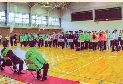
10/11 会津若松地区 地域安全運動出動式(会津若松市)

10月16日(水)に喜多方市で開催予定であった「第40回全国地域安全運動福島県民大会」については、台風19号により、県内で甚大な被害が発生したことを踏まえて中止となりました。